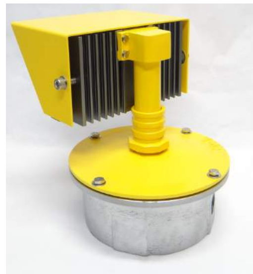
Modelo PH-30L + Caixa suporte CIL/P2